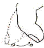
Don't touch the other string